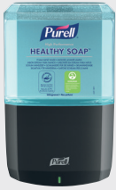
PURELL ES8 SANS CONTACT 7734-01