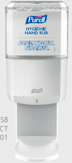
PURELL ES8 SANS CONTACT 7720-01

Exceptionnelle efficacité antimicrobienne – Élimine 99,99 % des microbes les plus courants.