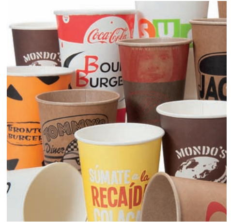
Vasos de cartulina Gobelets en carton Cardboard cups