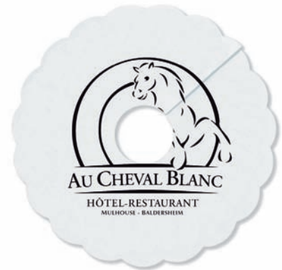
Salvagotas Anti gouttes Drip-mats