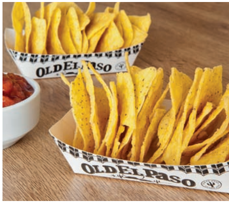
Barquillas Barquettes Containers