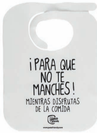
Baberos de un solo uso Bavoires à usage unique Disposable bibs