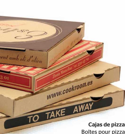
Cajas de pizza Boîtes pour pizza Pizza boxes