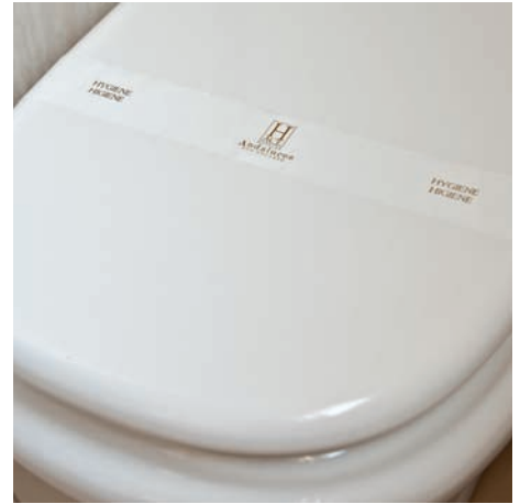
Banda precinto wc Bande sanitaire wc Wc seal band