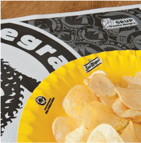
Platos de cartón Assiettes en carton Cardboard dishes