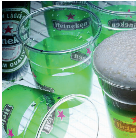
Vasos transparentes Gobelets transparents Transparent cups