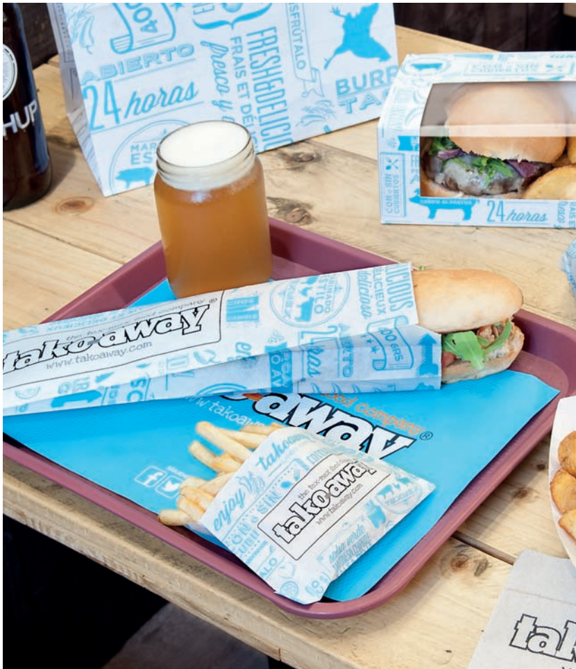
Bolsas antigrasas Sachets ingrassables Greaseproof bags