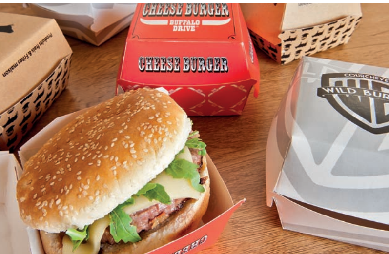
Conchas para hamburguesas y hot dogs Coquilles pour burgers et hot dogs Boxes for burgers and hot dogs