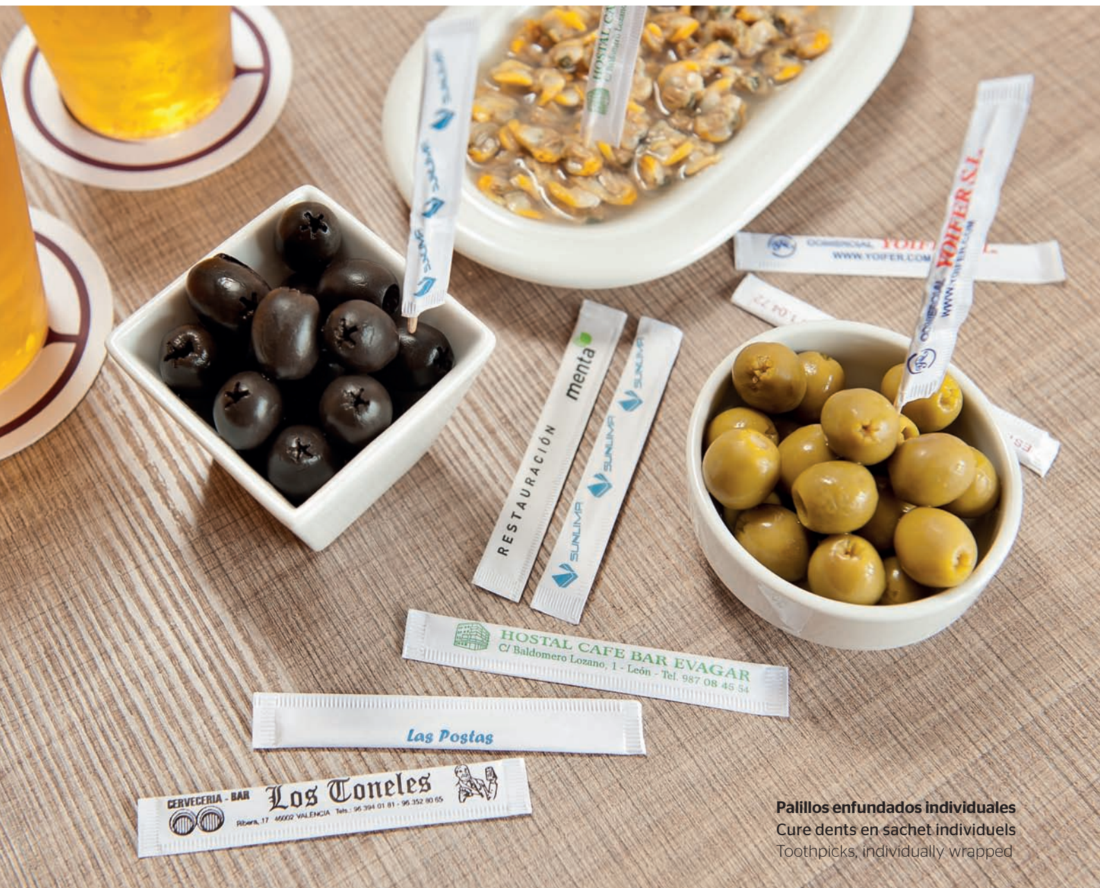
Palillos enfundados individuales Cure dents en sachet individuels Toothpicks, individually wrapped