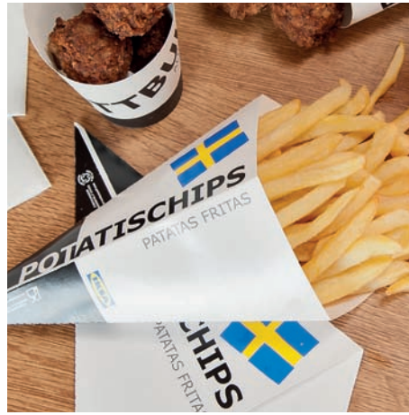
Cucuruchos para fritas Cônes pour frites French fries cones