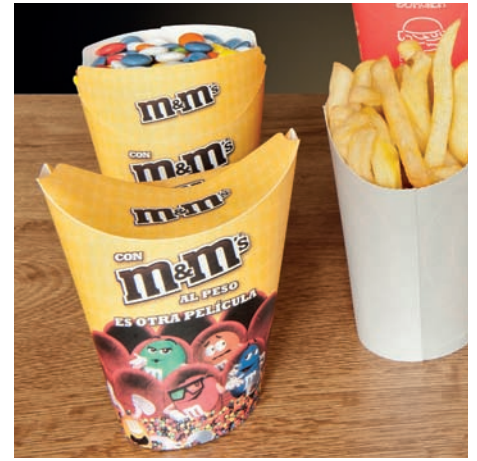
Vasos de cartulina con cierre y abiertos Gobelets en carton avec fermeture et ouverts Flip-top and open containers

Aquí encontrará todo lo que necesite. Como especialistas del sector realizamos todo el proceso de producción, desde el diseño hasta la impresión.