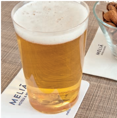
Posavasos Dessous de verre Coasters