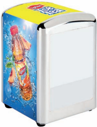
Dispensadores Mini Servis Distributeurs Mini Servis Mini Servis dispensers