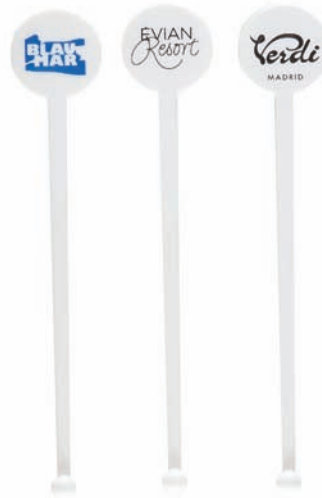
Agitadores Agitateurs Stirrers