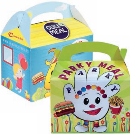
Cajas infantiles de cartulina Boîtes pour les enfants en carton fin Children's cardboard boxes