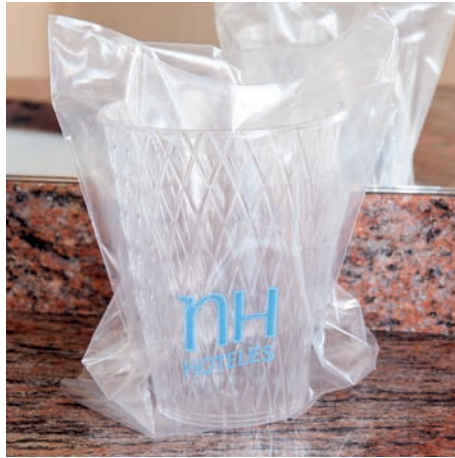
Bolsas protección de vasos Sachets de protection des gobelets Bags for protection of glasses