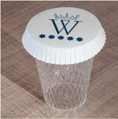
Tapas para vasos Couvercles pour gobelets Lids for glasses