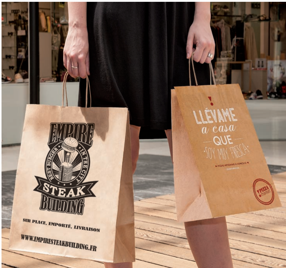
Bolsas Sacs Bags