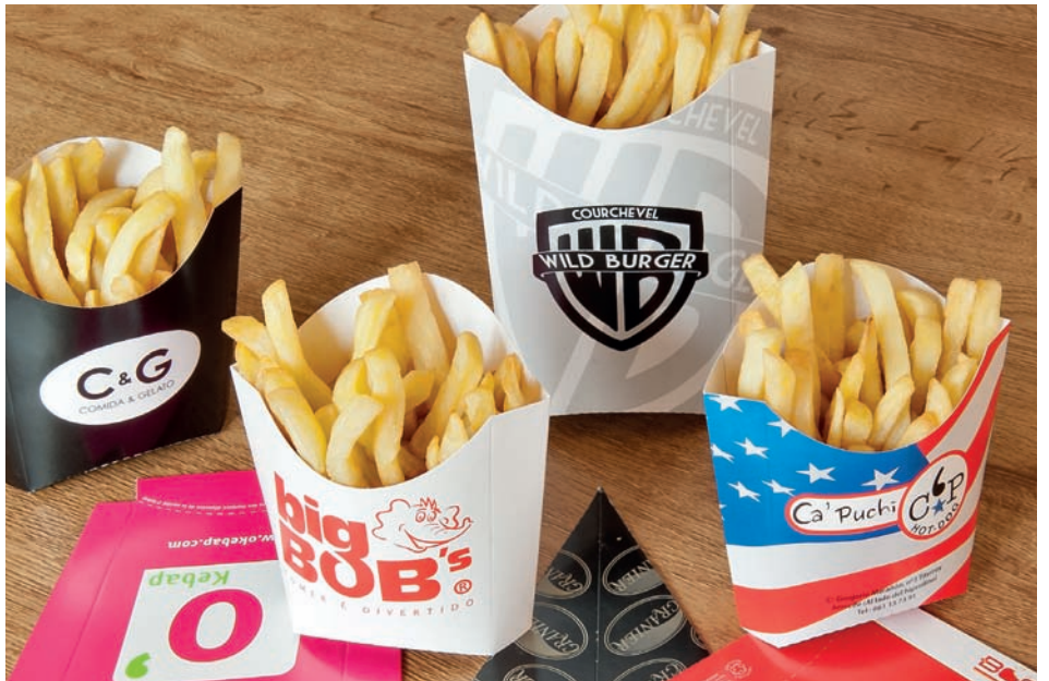
Cajetillas para patatas fritas Boîtes à frites Fries containers