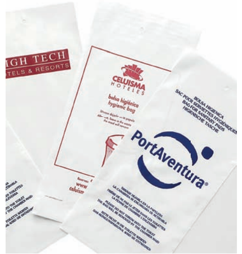
Bolsas higiénicas Sacs hygiéniques Hygiene bags